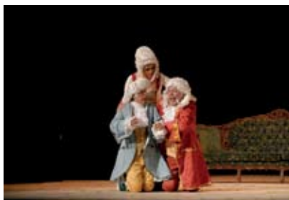
Escena de Prima la musica, poi le parole , de Salieri