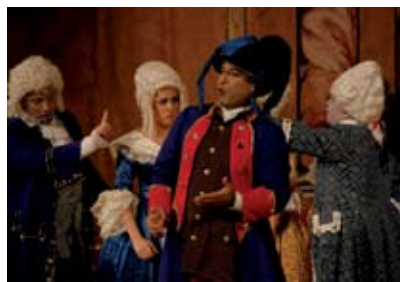
Escena de El empresario , de Mozart