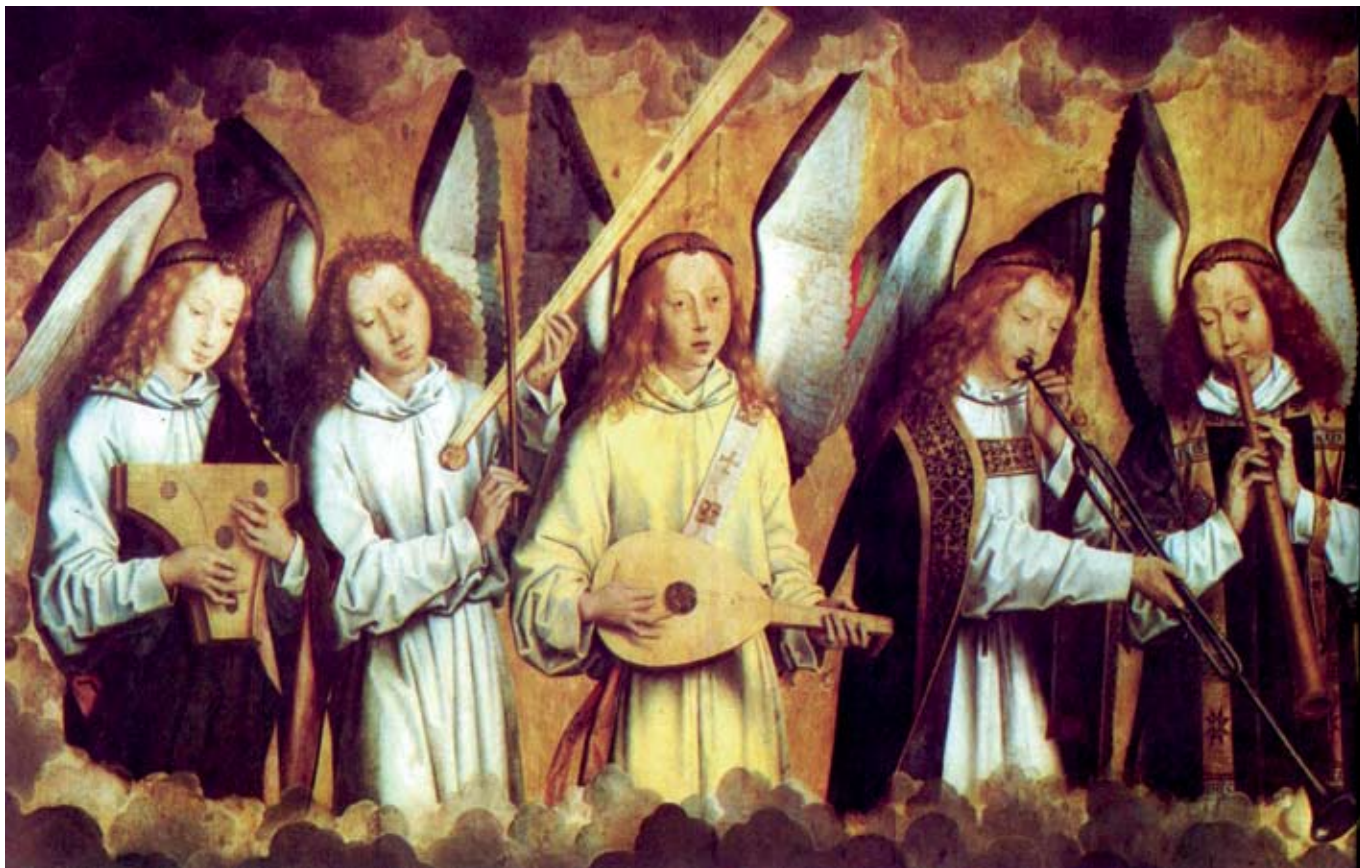
Pintura de Hans Memling (circa 1480), que representa una orquesta de ángeles tocando un salterio, una tromba, un laúd, una trompeta doblada y un caramillo tenor.