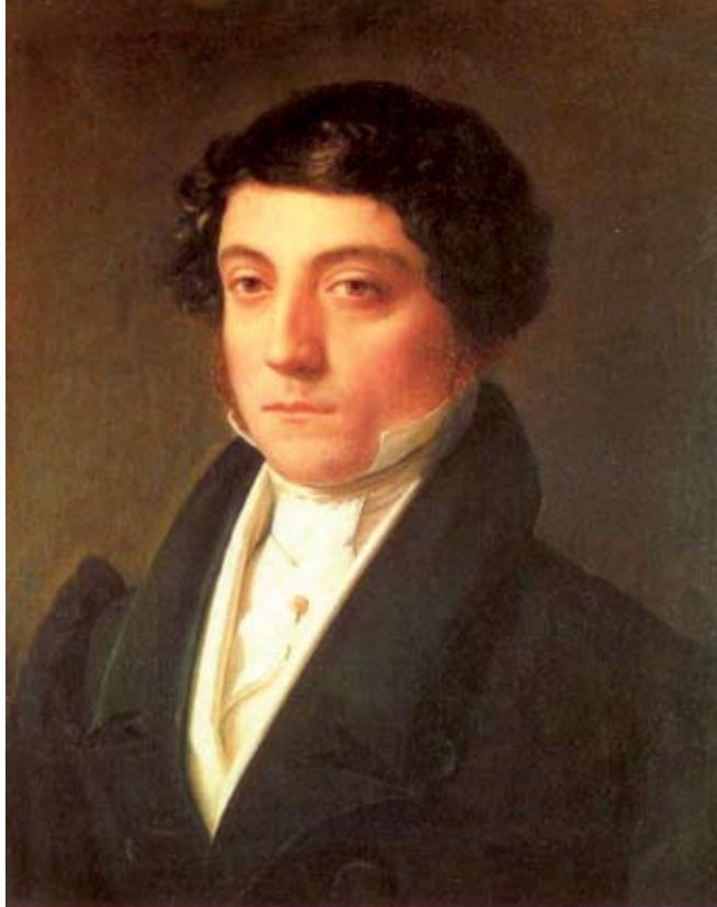
Rossini, en la época de las farsas