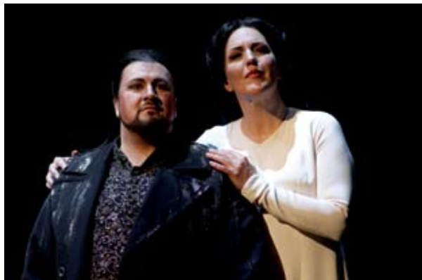
Torsten Kerl y Adrienne Pieczonka en Die Frau ohne Schatten