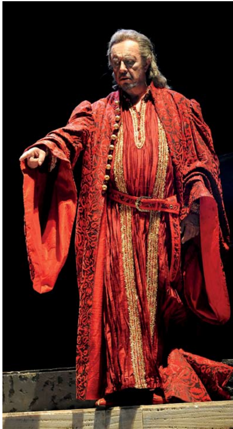
Simon Parma.jpg Leo Nucci como Simon Boccanegra en Parma