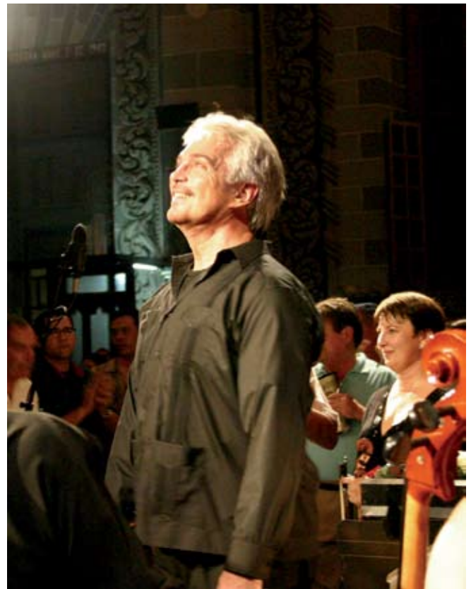
“Le he dado toda mi vida a la ópera”

Eso deseamos. Quisimos que los resultados fueran muy transparentes. Darles gusto a todos es imposible. Todo concurso es difícil en ese sentido y más en uno de ópera, en el que cada quien tiene su posición y gusto muy personal. Pero estamos echándole muchas ganas, y deseamos que cada vez sea más serio y esté mejor organizado para que venga gente de todo el mundo. Queremos que