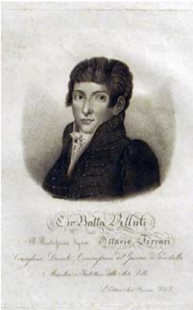
El castrato Giambattista Velluti, el primer Arsace

El viejo dueño del verdoso terreno de la campiña italiana observaba cómo sus trabajadores implementaban novedades agrícolas que había comprado recientemente, mas a su mente acudieron antiguas imágenes evocadoras de un canto immaculado que hacía vibrar audiencias, las conmovía, las excitaba. Recordó los triunfos en La Scala, en tantos lugares, los interminables “líos de faldas internacionales”. El anciano sonrió. Ahí era el patrón, de la rara voz, con muchas medallas y curiosidades, que había tenido una vida intrincada. Y el angélico sonido que había embelesado al público era su voz, pues en otro tiempo se le conocía como Giambattista Velluti (1780-1861), el último gran castrado.