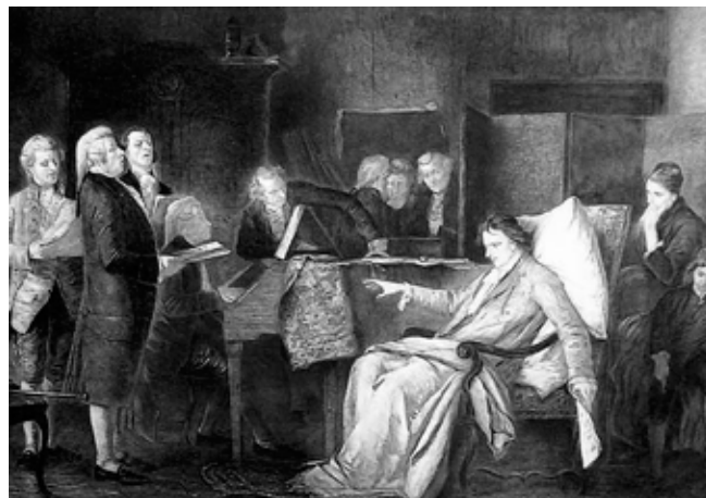
Ilustración que muestra a Mozart componiendo su Requiem , con ayuda de sus alumnos y amigos

Citando al musicólogo Joseph Pascual acerca del Requiem , "en esta composición confluyen el Mozart operístico y el religioso, el Mozart cautivado por el contrapunto de Bach y el Mozart clásico, el compositor lírico y el autor dramático, la expresión más desolada y ciertos indicios de esperanza, el Mozart temeroso de Dios y el Mozart masón".