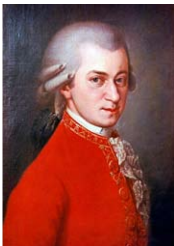
Wolfgang Amadeus Mozart (1756-1791)

Más allá de la calidad artística y delicadeza de su significado, si el Requiem es uno de los capítulos más famosos en la historia del arte, se debe en gran medida al fantástico nimbo que los cronistas y musicólogos románticos colocaron sobre las circunstancias que rodeaban a Mozart durante la composición de la partitura. No obstante, la investigación musical a lo largo del siglo XX fue difuminando la imaginación desbordada, equilibrando las exageraciones y denunciando los documentos apócrifos, haciendo posible un acercamiento más justo a la historia de esta importante pieza.