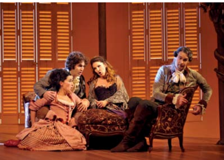
Escena de Le nozze di Figaro en Lieja