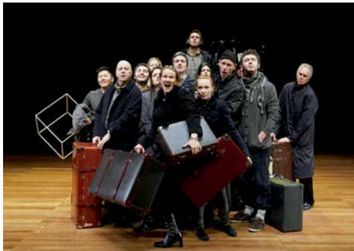
Escena de The Fairy Queen en Luxemburgo