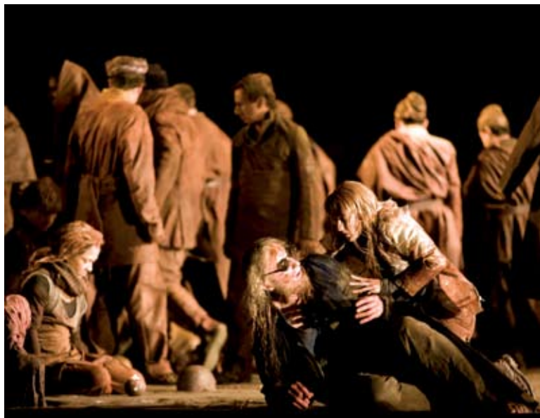
Escena de Oedipe en Bruselas